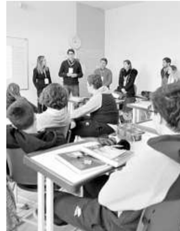
Oficina foi realizada no Ensino Médio